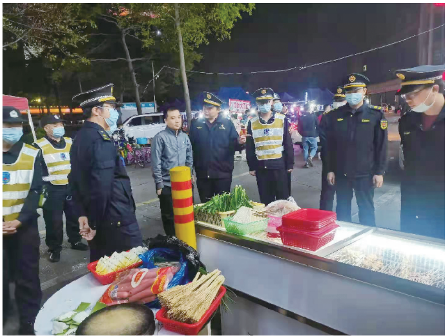
对辖区内的公园、市场及周边卫生秩序进行突击巡查

广东建设报讯 记者誉建业,通讯员孔淑贞、彭碧云报道:“稍息!立正!”3月2日,由佛山市禅城区城市管理和综合执法局牵头,联合祖庙街道、石湾街道行政执法办公室对禅城区内夜市经营情况进行专项检查,分别对石湾镇街辖区的榴苑路、汾江南路里水烧烤一条街、潮州美食城、黎明路,塘头市场商贸城;祖庙街道文华北路、市东上路、兆祥路、朝安南路、东升村鲤鱼沙等重点区域进行检查。行动中,共对17家占道经营的宵夜大排档进行整治,执法人员并对商家进行教育劝导,强调商家要按照卫生和城市管理规范进行经营,还市民干净宽敞整洁的道路出行环境。 为做好巩固国家卫生城市工作,禅城区城市管理和综合执法局城管执法人员连日对辖区内的公园、市场及周边卫生秩序进行突击巡查,共劝离公园游商20宗,对区内同济市场、普君市场、南堤市场等重点市场周边存在的占道经营、卫生死角等问题,对12户商家进行教育宣贯,并要求市场管理方加强管理。 在联合整治行动中,大部分商家能配合工作,行动也取得一定的效果。据了解,对于商家占道经营的行为,城管执法部门可依据《佛山市城市市容和环境卫生管理规定》对其进行处罚的,最高可处以人民币5000元的罚款。 此外,禅城环卫部门还开展城市主次干道大清洁专项行动,有效改善禅城区城市环境卫生质量。行动期间,每天安排约1050名一线保洁人员,对管养范围内的七纵七横道路开展人工保洁工作。为保障道路环卫设施洁净,一线保洁人员每天对道路果皮箱开展不少于2次的