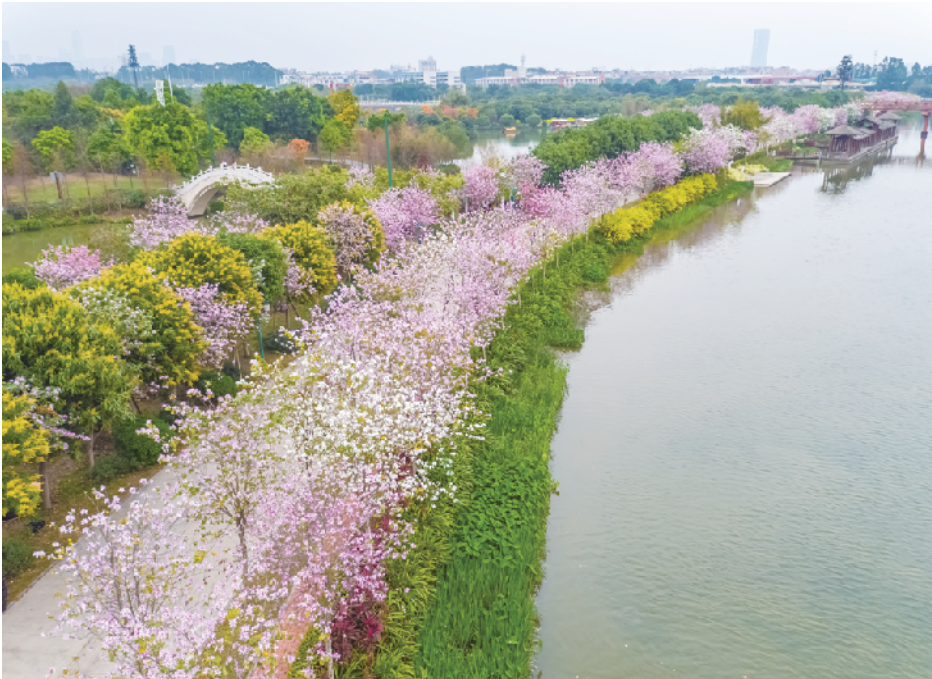
海珠湿地宫粉紫荆