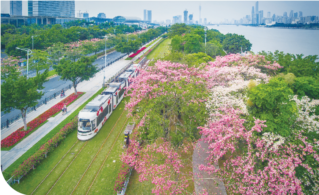
海珠区阅江中路段

通直，生长迅速，养护容易，能够适应当地环境条件等。而芒果树属于岭南乡土树种，恰好符合这几大特征，特别是其生长快、冠幅匀称、不易风折且长寿等优点获得了园林绿化部门的青睐。“广州街边的芒果树大多已种植了几十年，最近种的也有十余年了。虽然没有统一要求栽种，却几乎大小城市的行道树都喜欢选择它。”工作人员说。 但值得注意的是，果树长大挂果后，会有部分市民攀爬采摘，对行道树或者绿化色块造成损坏；在每年6、7月份芒果成熟的时节，经常会有果实自然落地腐烂污染地面，造成卫生或气味问题。近年来，果树落果砸伤路人或致人滑倒磕碰的新闻也偶有出现。 对于这些问题，园林管理相关单位也会采取一些针对性的措施：比如指导养护单位在绿化芒果结果期向果树喷洒脱果剂让芒果自然脱落，分阶段控制挂果量，防止芒果成熟长大；对已成熟的芒果统一安排有关养护单位有计划地进行采摘，避免意外事故的发生；同时加强宣传、引导，呼吁市民爱护绿化树种，切勿采摘食用绿化芒果。