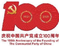
庆祝中国共产党成立100周年 The 100th Anniversary of the Founding of The Communist Party of China