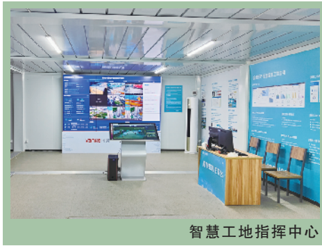
智慧工地指挥中心