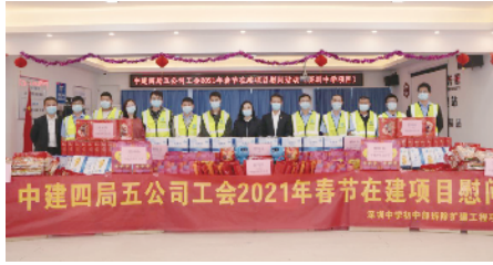
中建四局五公司工会开展2021年春节在建项目慰问

在学雷锋月期间，中建四局五公司广东分公司各项目团支部分纷纷上线雷锋精神，开展“弘扬雷锋精神·青春奋斗强国”主题志愿服务活动，将义诊、义剪及免费体检等贴心服务送进工地生产一线；同时开展社区防疫志愿服务、路障清理、清扫街道卫生、关爱妇女权益等特色志愿服务活动，充分展现央企的责任与担当，树立良好社会形象，提升企业社会影响力。