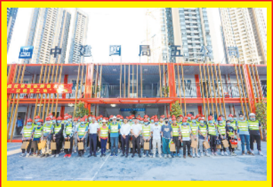
通过理论教育、劳动竞赛等活动，积极搭建青年职工成长平台，调动员工围绕企业改革发展和生产经营建功立业。