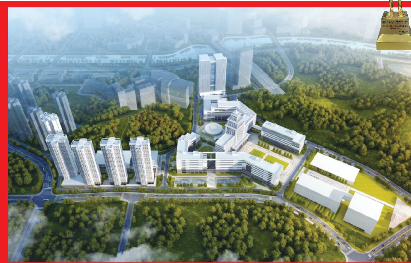
哈工大项目作为广东省第一个获得“鲁班奖”的装配式建筑，对于行业来说有着非凡意义。