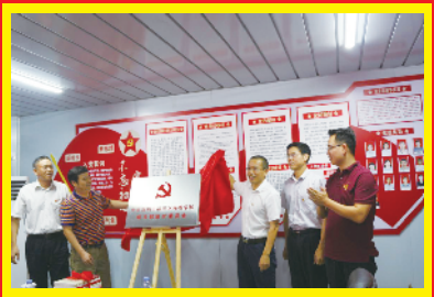
成立梅香学校项目临时党支部，充分发挥党支部战斗堡垒作用和党员先锋模范作用，将建设相关方整合起来，凝心聚力，助力项目攻坚克难。