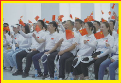
通过开展“建证百年 红色传承”主题活动，不断增强公司党员干部的责任感和使命感。