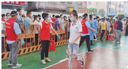
中建四局五公司广东分公司志愿者队伍，协助社区坚决打赢疫情防控硬仗，为防疫一线贡献中坚力量。

为推进安全生产责任落实及系统治理，全面提高安全生产基础管理能力，中建四局五公司创新管理模式开具“六大处方”寻脉问诊全力确保公司安全生产良好态势。一是实行全员“安全风险抵押”。通过签订《安全生产风险抵押责任书》，缴纳安全风险抵押金，实行奖罚对等、同奖同罚，有效促进项目各岗位人员积极主动履行安全管理职责。将各部门、各岗位紧密联合，提高安全生产管理工作的团队协作能力；二是建立“行为安全之星”活动智慧平台。通过信息化工具+大数据后台+前端展示，将“行为安全之星”“智慧工地”和“无人超市”相结合；工友进场后，领取带有积分功能二维码的行为安全之星表彰卡，卡上积分为场内流通“虚拟货币”，管理人员可直接通过小程序为工友“扫码”发卡；三是安监人员亮身份。为所有在建项目配备执法记录仪、喊话器和监督背心；四是实行临时用电“家庭化”。从本质安全的角度出发，优化了配电箱结构，箱内电气线路和电器元件，增设内封闭门和工业插座；依据项目结构类型和临时用电情况设置33幅系统图纸，集中招采，从源头上消除临时用电私拉乱接的现象，使临时用电管理常见隐患得到有效遏制；五是作业指导书强实效。从室外消防水设置等五项板块入手，全面提高项目生活区消防标准，同时，从生活区火灾预防和火灾初期控制角度出发，运用智慧化科技，安全使用火灾预警系统和灭火系统，项目“拿来就能用”，全面降低生活区火灾发生的概率；六是宣教交底无死角。将安全宣教融入工友工作、生活细微之处，通过教育基地、驿站二维码、答题“赠”wifi、警示教育片等形式，增强安全宣传教育吸引力，实现安全生产意识入耳、入脑、入心、入行。