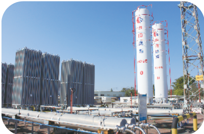
广州中燃气化站罐区