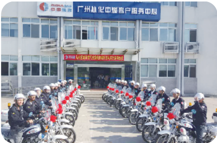
抢险摩托车启用仪式

从化城区部分街巷狭窄,在交通高峰期易发生拥堵,给燃气事故抢险带来很大的阻碍。为提高燃气抢险效率,在摩托车使用严格受限的特殊背景下,广州中燃总经理利用政协委员的身份,克服种种困难,推动区政府同意核发号牌,组建了一支由30多辆摩托车组成的“广州中燃摩托车应急抢险队”。这是广州地区燃气行业第一支、也是到目前为止唯一的一支摩托车应急抢险队。摩托车抢险队平战结合,平时负责巡线、上门服务等工作,一旦发生事故,则负责警戒、抢险。有一次,一施工队在施工过程中,将燃气管线顶穿,导致气体泄漏,摩托车抢险队接报后仅用5分钟赶到事故现场,并立即拉起警戒线,组织