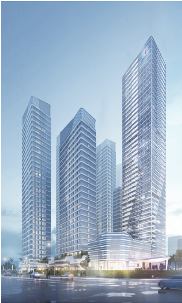
珠海中海南航项目效果图

品牌影响力方面，2018年，广州亚运城F2项目成功举办广州市番禺区住建系统工程项目现场观摩交流会，成为广州分公司在粤的第一个区级观摩。2019年，佛山市2019年“质量月”启动会在卓越浅水湾项目举办，是工程局首个广东省省级观摩会，迎来了2500人次的现场观摩，线上浏览量突破100万人次，赢得与会领导、参会代表及省级媒体高度赞誉。2020年，珠海中海南航项目承办珠海保税区建筑工地综合应急演练得到大横琴区管委会的充分肯定，被珠海电视台宣传报道。