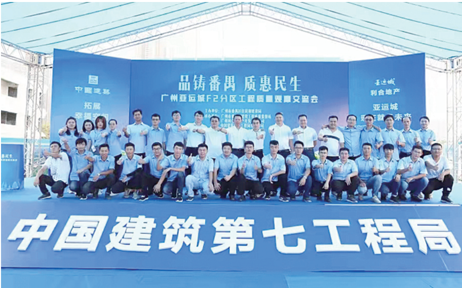
广州亚运城 F2 分区工程质量观摩交流会