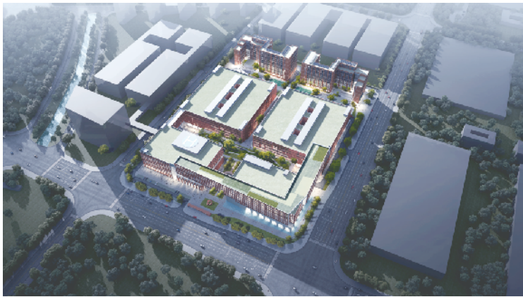
江门麦克韦尔电子科技产业园项目