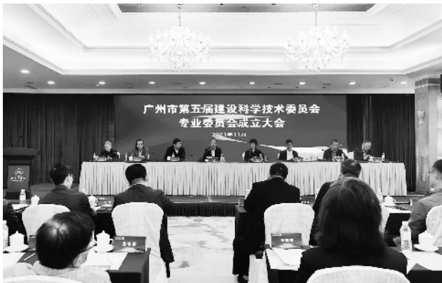
本届专业委员会人数增长46%

会议指出,广州正处在实现老城市新活力、“四个出新出彩”,巩固提升城市发展优势的关键阶段,各专委会在市建设科技委工作中具有基础性地位和作用,新一届各专委会应继续秉承新发展理念,围绕城市高质量发展的新要求,充分发挥委员主体作用,为“四个出新出彩”作出积极贡献;加强重大课题研究,以科技创新推进新