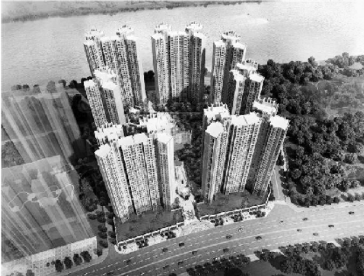
大沥镇熹云水岸花园效果图