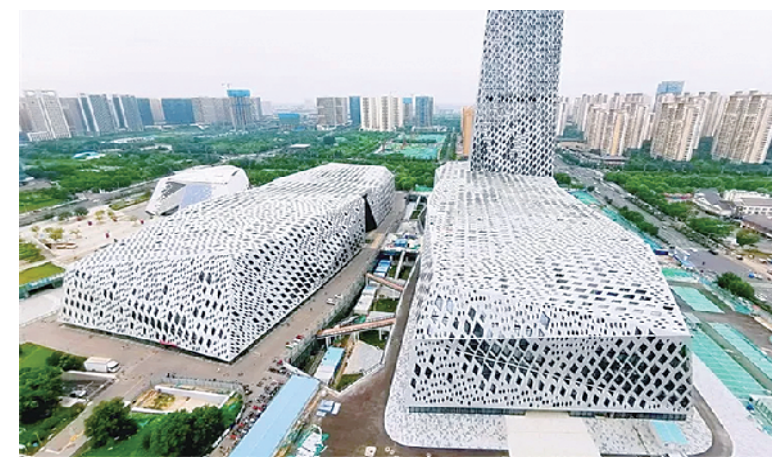
3、弘阳广场 (项目地点: 山东济南)

上榜理由: 用无功能的超尺度形式附会飘带概念, 造型浮夸浪费, 属于假大空设计的代表作。