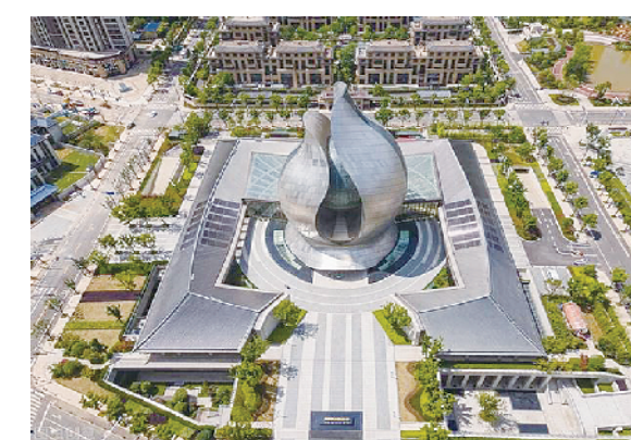
9、中国建筑科技馆 (项目地点: 湖北武汉)

上榜理由: 设计以象形手法模仿“种子”造型, 牵强附会, 背离当代建筑科技主题的表达。