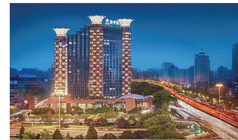
4、维景国际大酒店 (项目地点: 北京)

上榜理由: 以枯燥的单一表皮整体覆盖多种功能, 超大尺度的建筑体量, 危害城市视觉环境。