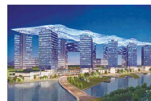
7、G60 科创云廊 (项目地点: 上海松江)

上榜理由: 用虚假、浪费的夸张手段盲目追求城市奇观, 以掩盖建筑主体的平庸设计。