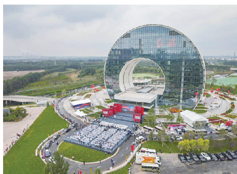
5、一汽红旗创新大厦 (项目地点: 吉林长春)

上榜理由: 建筑更新改造未能纠正原有设计缺陷, 越改越丑, 有损首都东大门的城市形象。