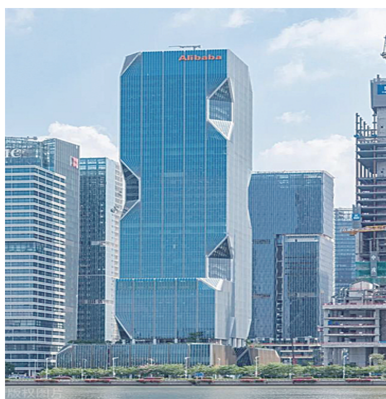
6、阿里巴巴华南运营中心 (项目地点: 广东广州)

上榜理由: 整体设计思路因袭象形化的形式主义套路, 设计语汇自相冲突, 影响企业“创新”形象。