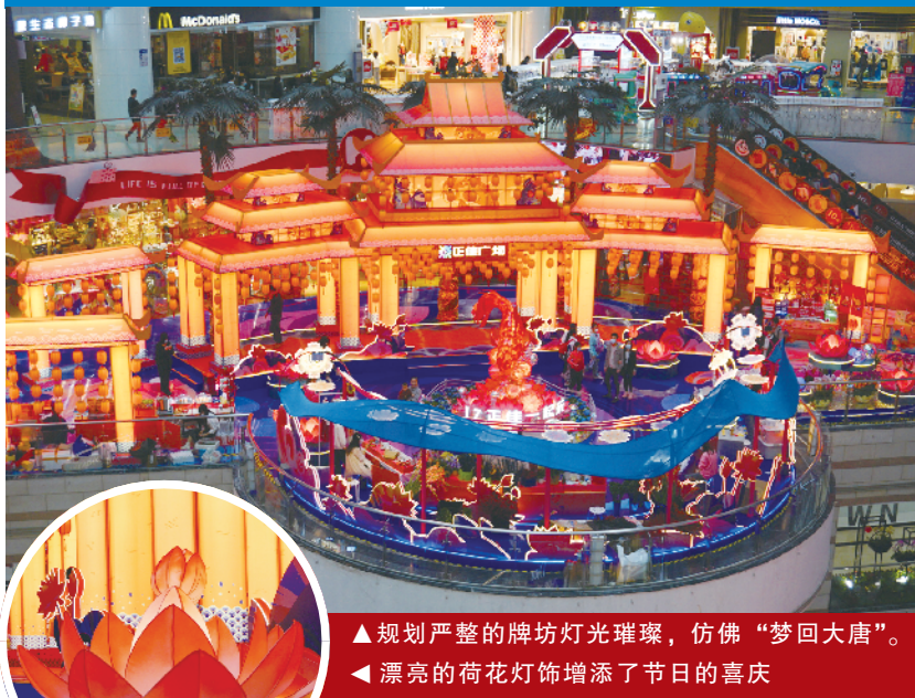
▲规划严整的牌坊灯光璀璨，仿佛“梦回大唐”。 ▲漂亮的荷花灯饰增添了节日的喜庆