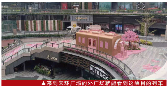
▲来到天环广场的外广场就能看到这醒目的列车

在旁边“售票处”买上一张车票，搭上这列幸福列车，窗外是美丽的大湾区风景，带给你新年好心情。