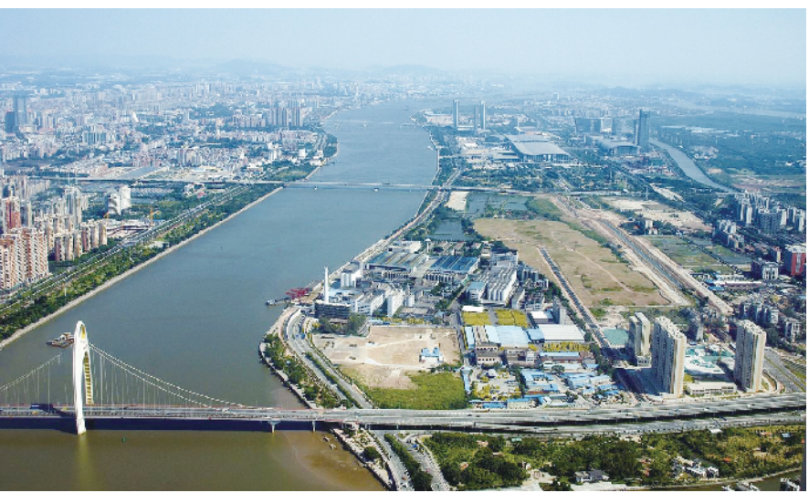
为保护水体和水生动植物，规范采砂刻不容缓。

内）序列中，禁止采集河砂的有：自东江北干流东莞市石龙北起向西至白鹤洲转向西南，经狮子洋水道至珠江虎门大桥止的干流河道；自广州市番禺区沙湾镇紫坭，经沙湾水道，至南沙区沙仔岛止的干流河道。 广州市管河道方面，禁采河砂区有：流溪河干流（良口坝以下至流溪河口）；新街河干流（莲塘新村至新街河口）；白坭河（花都区与清远市交界处至鹤岗（含国泰水））；珠江西航道（鹤岗至洲头咀）；珠江前航道（洲头咀至大濠沙）；珠江后航道（洲头咀至黄埔新港）；蕉门水道（西樵头（与沙湾水道交界处）至南沙水文站（含西樵水道））；驷岗水道（鱼窝头南边水闸至万洲尾（接蕉门水道））；上横沥水道（义沙围沙头顶至灵山七一尾（接蕉门水道））；下横沥水道（义沙围沙头顶至安益围尾（接蕉门水道））；洪奇沥水道（三善泓水文站至万顷沙西水文站）；三枝香水道（番禺区洛溪村（接后航道）至番禺区新基水闸）。