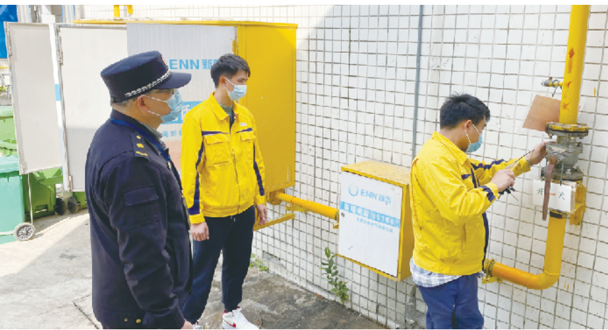
石排城管分局组织对校园燃气管道进行安全检查

里。莞城城管分局的执法人员还对学校周边店铺中存在燃气安全隐患的进行了现场监督整改。 保障学生出行安全方面,考虑到目前上学、放学时段天色较暗,为确保“求学”之路的安全,石排城管对镇内学校的路灯进行了检查维修,照亮学子求学路,杜绝安全隐患。 在整治校园周边环境秩序方面,“城管蓝”加大对校园周边擅自摆摊设点、占道经营、机动车乱停乱放等高发行为的整治力度,做到早发现、早制止、早查处、早取缔,并向周边商户做好“门前三包”宣传工作,引导商户文明经营,共同做到“扫干净,摆整齐”,维护良好的市容环境。行动期间,莞城城管分局共出动执法力量 46 人次、23 车次,对街道内 4 所学校的周边店铺进行巡查管理。对巡查发现的占道经营、乱摆卖的店铺当事人进行了法规教育,并责令其现场整改完成。巡查中,共整改教育城市“六乱”行为 65 宗、店铺占道经营