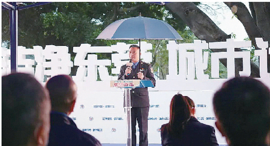
东莞市城市管理和综合执法局局长刘永定就城市精细化管理发表观点

三是要千方百计抓好城管队伍执行力建设,各分局领导务必团结一致发挥头雁作用,打造温暖、有执行力的队伍。