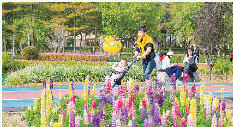
亚艺公园内一位家长推着婴儿车经过花海

据统计,此次活动有6万多名学生参与,在全区中小学范围内活动覆盖率达80%,达到了宣传与推动学生积极参与垃圾分类、提高垃圾分类意识和环保意识、普及垃圾分类常识、带动身边人共同践行垃圾分类的目的。