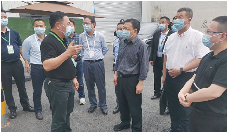
省住房城乡建设厅赴佛山开展疫情防控暨安全生产督导检查

近日，住房和城乡建设部下发通知强调，各地要深入落实《关于进一步强化安全生产责任落实 坚决防范遏制重特大事故的若干措施》（以下简称“安全生产十五条措施”），要求尽快组织开展住房和城乡建设领域安全生产大检查、大排查、大整治，全面深入排查重大风险隐患，列出清单、明确要求、压实责任、限期整改，坚决防止隐患演变为事故。