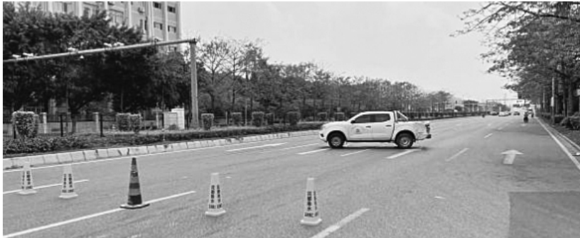
4月11日被违法偷排车辆撞损的花都排水公司工作用车

2019 年以来，广州市河长办组织突击检查力量，持续严厉打击吸污车违法偷排行为，先后在番禺、天河、越秀等区抓获多名偷排违法分子。为进一步彰显治污决心，2022 年 3 月 21 日，广州市河长办根据掌握的线索，牵头组织花都相关职能部门在花城南路 2 号布控。