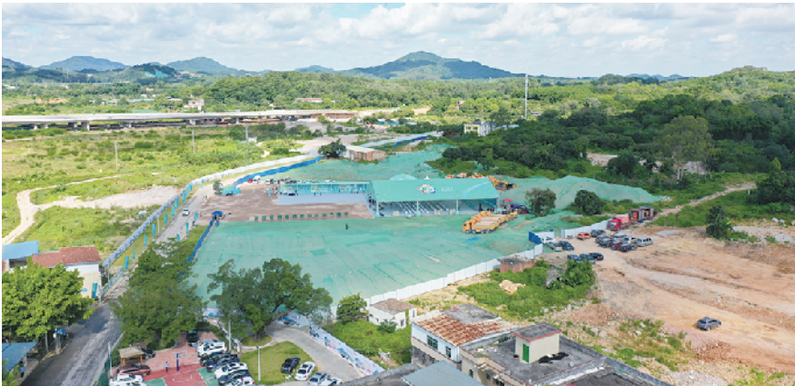
新乡村示范带首开区动工活动现场

其中，在传承和保护历史文化方面，此次更新改造项目也要起了“绣花功夫”。通过科学划定功能分区，活化莲塘、重岗、燕塘古村资源，以“保护+治理+开发”将历史文化保护、乡村振兴、现代运营管理和旧村改造有机融合。