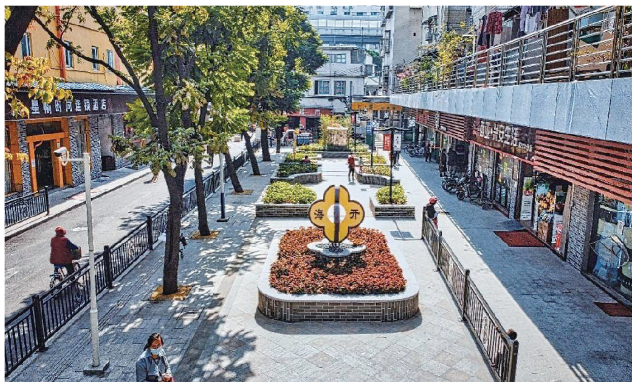
海珠区仁厚直街口袋公园

广州市民惊喜地发现,越来越多的口袋公园在家门口出现。据有关部门公布的数据,截至 2021 年底,广州共建设完成约 200 个口袋公园。口袋公园提高了广州大街小巷的颜值,成为居民喜闻乐见的休闲好去处,是广州市着力提高公共服务均衡化、优质化水平、为老百姓提供普惠民生福祉的直接体现。