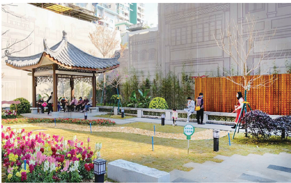
荔湾区龙津街口袋公园

袋公园采用鱼的抽象形状作为设计理念,以流水的形态为布局手法建设,是一个集健康生态、休闲运动、人文传承等多功能为一体的口袋公园。 2021 年 12 月,记者看见,崭新的公园里有儿童游玩设施、适合成人使用的运动设施、适合散步的林荫绿地,还有文化小舞台和文化长廊。其中,文化长廊颇具地方特色,长廊采用绘画的形式展示江埔街罗洞工匠小镇、从化大桥等工程的建设特色。 一名在公园游玩的市民说,如今一家老、中、青三代都很爱来这个公园玩,大家在这里找到了适合自己的休闲好去处。