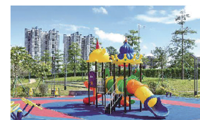
从化大桥口袋公园

在广州从化江埔街新田新村边上“长”出了一个口袋公园,受到周边居民的关注。近日,记者来到这个居民区边上的口袋公园探访。占地 7400 平方米的公园一边挨着从化大桥,一边挨着新田新村居民区。正值傍晚时分,不少住在附近的家长带着小孩在公园的儿童区玩耍。 一名住在附近多年的居民说,此前这个地方是一块荒地,长满杂草,废旧电线杆和杂物随处可见,家长们不敢带小孩来这里休闲玩耍。 为满足群众日益多样化、差异化的文化需求,改善人居环境,2021 年 4 月,从化启动口袋公园建设。江埔