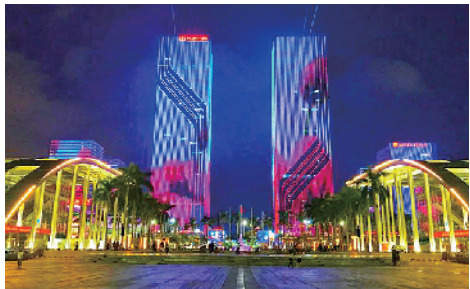
江门市环五邑华侨广场商圈

南(试行)》《广东省夜间文旅消费集聚区评价指标(试行)》,随即又组织首批省级夜间文化和旅游消费集聚区申报评选。在政策利好推动下,全省各地正积极打造各类夜间文化和旅游消费集聚区,夜间文化和旅游经济发展势头良好,已涌现出“Young 城 Yeah 市”“夜佛山 越夜越精彩”“夜色惠精彩”“夜侨都”等一批具有浓郁地方特色、在省内乃至全国叫得响的品牌项目。