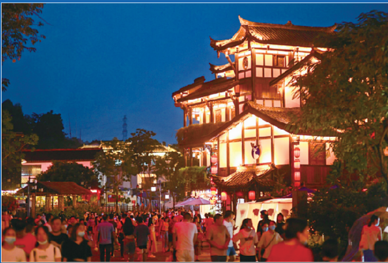
深圳华侨城甘坑古镇