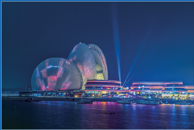
珠海海韵城大剧院文旅综合体