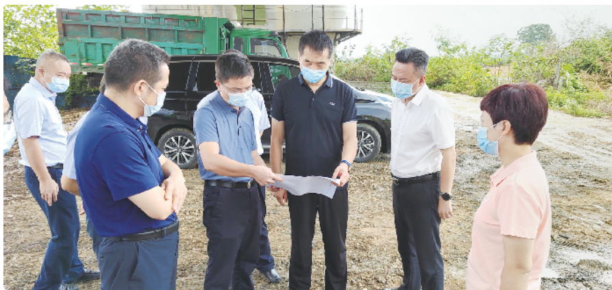
工作组现场了解情况

工作组指出，铁路沿线安全隐患整治是一项长期的系统工程，地方政府和铁路部门要提高政治站位，切实担起安全隐患治理责任，各自指定牵头部门做好对接，紧密配合、协同推进。要压实