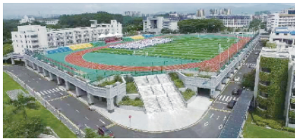
市民服务中心停车场