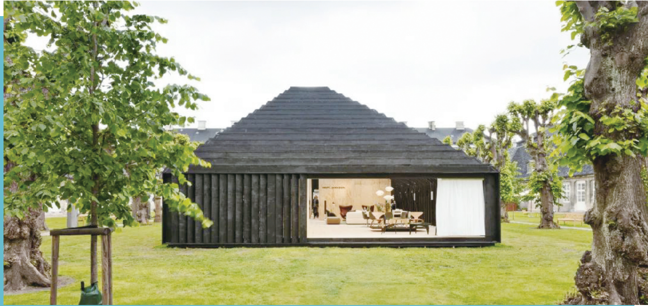
Fritz Hansen Pavilion 家具展馆