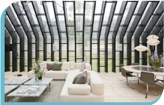
Fritz Hansen Pavilion 家具展馆

遵照循环设计思想, 该展馆为“可拆卸”而设计的: 建筑的木框架用螺丝钉固定在地面上, 由于没有任何东西被粘合或焊接在一起, 展馆可被完全拆卸。这确保最大限度地减少浪费, 并确保所有材料都可以在其他地方重复使用。