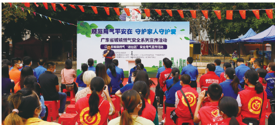
活动现场

器在使用中应注意？”“测试燃气泄露最安全有效的办法是？”……活动现场，一块彩色转盘上写满了燃气安全问题，居民通过转动大转盘，答对指针对应的燃气安全问题，就能获得相应的小奖品。