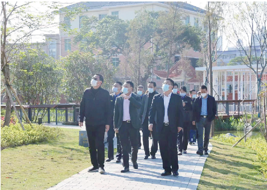
与会人员参观东莞美丽圩镇建设成果

随着工作有条不紊地推进，一系列改变呈现在广大市民的面前。城管片长制和“门前三包”工作、环卫暗访督导、“洁净城市活动日”等工作,使得“扫干净、摆整齐”逐渐成为常态;“三线”综合治理工作,使得杂乱的“空中蜘蛛网”变成排列整齐、标识清楚、安全规范的管线网络;“三边三地”整治提升行动,使得一个个曾经藏污纳垢的边角地变成“四小园”、口袋公园、生态绿地。