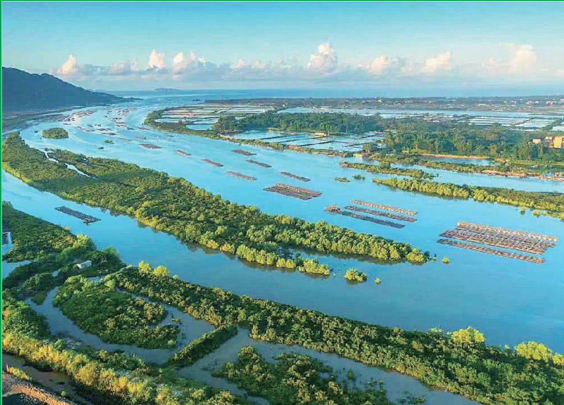
广东阳东寿长河红树林国家湿地公园