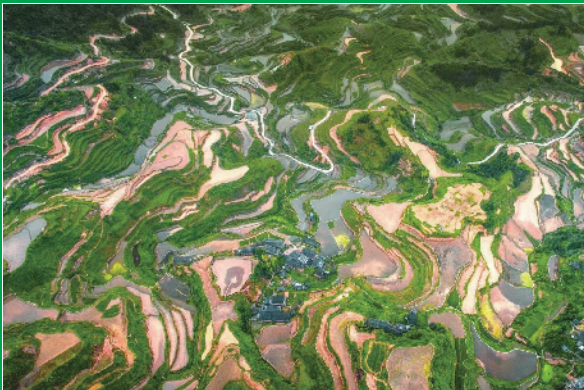
广东连南瑶排梯田国家湿地公园