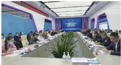
示评预备会顺利召开

广东建设报讯 记者陈克正、通讯员王富章报道：2 月 11 日，2022 年下半年“广东省房屋市政工程安全生产文明施工示范工地”示评预备会在中建八局华南