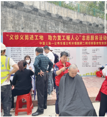
志愿服务活动现场

广东建设报讯 记者蒋雯菁，通讯员骆永芬、李丹阳报道：2 月 9 日，中建三局一公司岭南医院二期项目党支部与黄埔区爱帮志愿服务队联合开展“义诊义剪进工地 助力复工暖人心”主题志愿服务活动，为一线建设工友提供免费理发、免费体检等公益活动，助力项目复工复产。