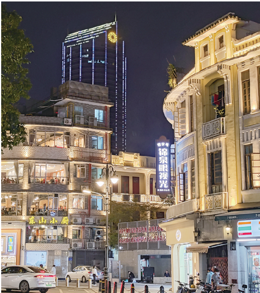
广州传统中轴线(近代)历史文化街区一角