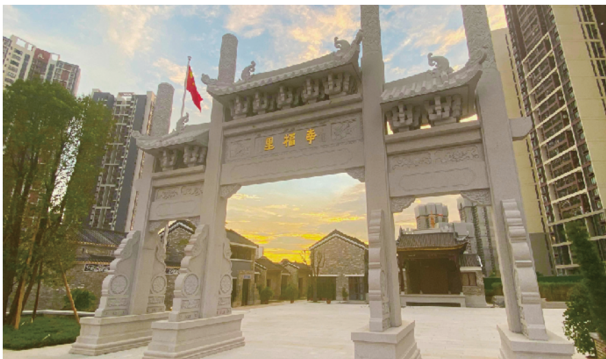
改造后的广州·幸福里

这里，曾经是黄埔最繁荣的中心街区之一，又称文冲廻龙市，如今这片古建筑街区有了崭新的名字——广州·幸福里。