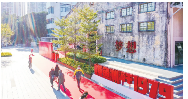
鳊鱼洲文化创意产业园

2019年,鳊鱼洲文化创意产业园正式对外开放,它的重新开发尊重场地地形、地貌特点,充分整合利用现有景观资源、环境资源、工业遗存资源,形成了“3+4”,即三大功能区(展览活动区、创意设计区、电商服务区)与四大业态(新产业、新商业、文化、旅游)有机融合的现代化文化创意产业园。