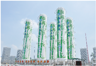
东永港华 LNG 应急站

党的二十大报告强调，要坚持安全第一、预防为主，完善公共安全体系，推动公共安全治理模式向事前预防转型。城镇燃气作为城市生命线当中的重要一环，对于完善我国公共安全体系具有关键意义。广州东永港华燃气有限公司（以下简称东永港华）自1998年成立20多年来，秉承“安全为首，以客为尊”