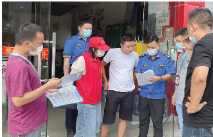
街道执法办、城管办、穗北社区等单位联合走访商户

承前启后，继往开来；日拱一卒，功不唐捐。九佛街道将全面贯彻党的二十大精神，持续锚定“一心两廊·九星荟萃”的发展蓝图，朝着“新兴产业第一街”奋勇迈进，以“莲重燕来”新乡村示范带串联整合丰富生态资源，加快推进白兰花森林公园、知识城北部片区水系连通工程建设、知识城生态徒步步道建设，结合莲间·塘里、永庄岭研学基地、极飞超级农场等多个乡村振兴项目，将山水生态价值融入绿美九佛画卷，乘改革发展东风，迎春色满园万紫千红，逐渐形成“蓝天白云常相伴，青山绿水绕城来”的城乡融合发展新格局，为实现黄埔“五年大变化”作出基层贡献，为广州争创首批全国文明典范城市增添九佛力量。