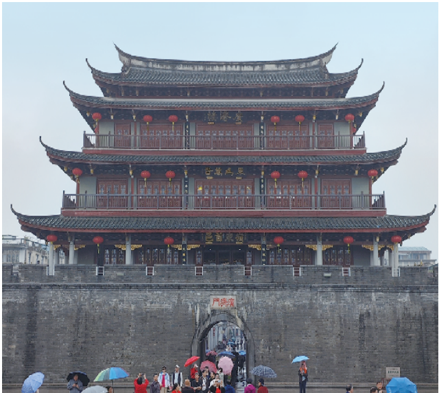
潮州广济楼