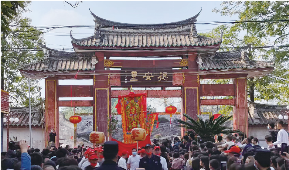
揭阳市普宁市洪阳镇德安里

8 个国家级历史文化名城、15 个省级历史文化名城、15 个国家级历史文化名镇、19 个省级历史文化名镇、25 个国家级历史文化名村、56 个省级历史文化名村、104 片历史文化街区、4170 处历史建筑，还有 292 个中国传统村落、数不胜数的各级古树名木……广东省坐拥丰富且多样的历史文化资源，如何在促进经济发展的同时，延续城市文脉，保护文化遗产，是每个城市管理者不得不面对和思考的问题，因此，广东的城乡建设领域肩负着做好历史文化保护传承工作的重任。