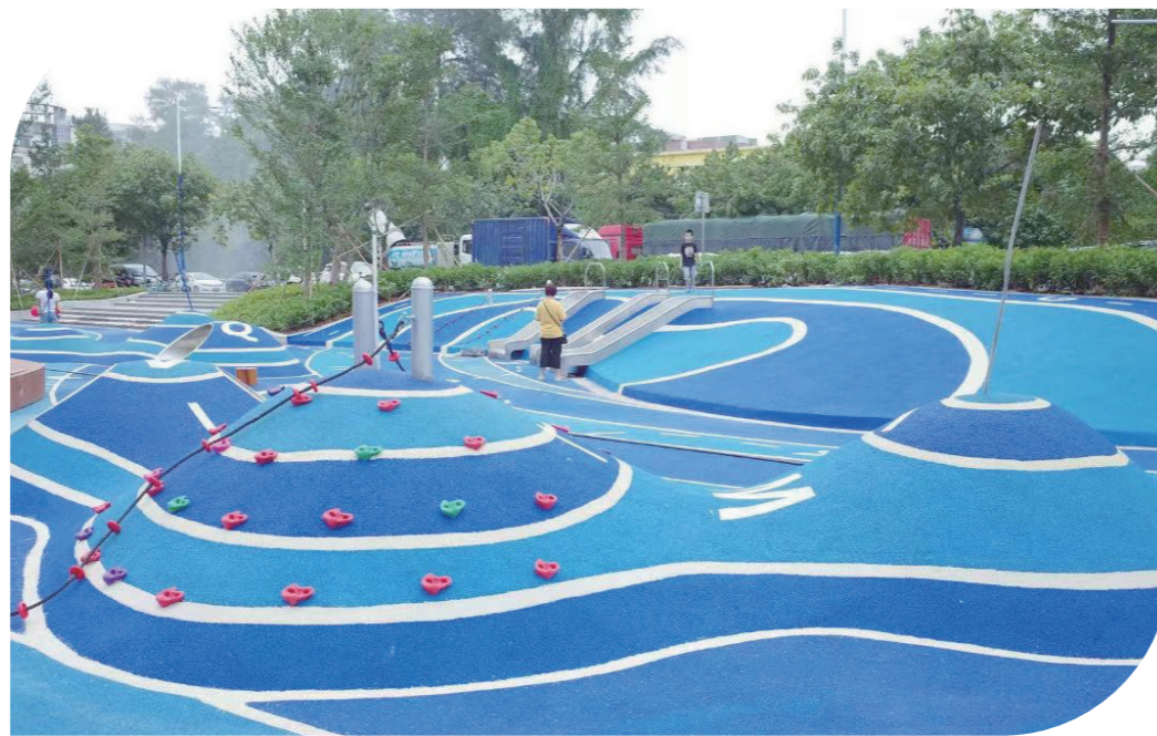
广州市荔湾区某商场外设立儿童游玩广场

事实上，这仅是广东在城市建设中“俯下身子”倾听儿童声音的一隅。自国家发改委发布《关于推进儿童友好城市建设的指导意见》以来，广州、深圳、佛山被列入建设国家儿童友好城市名单，多地积极探索，加快推进城市规划、设计、建设进行适儿化改造，以“1米高度”勾画城市未来。