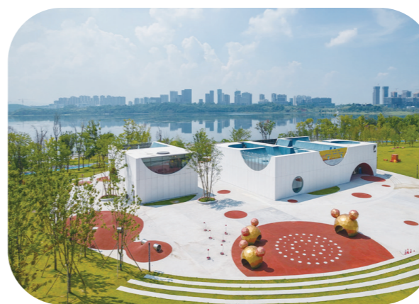
方·fun兴隆湖儿童艺术中心