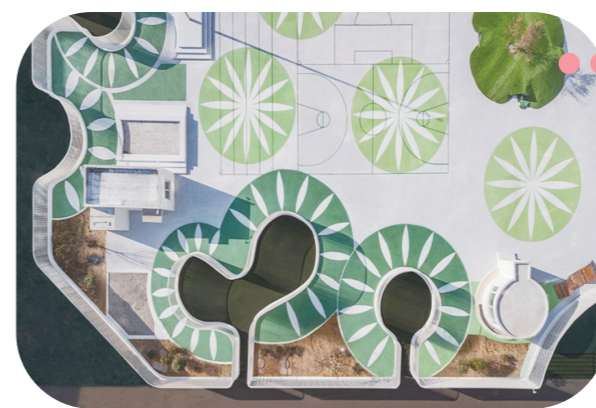
灵宝儿童成长中心

足够尺度的活动室前室保证儿童的活动不受天气影响。多种曲率的弧线形围栏模糊了成长中心与社区的界限感，儿童成长中心在社区中的有机嵌入，也增强了片区的运行活力。