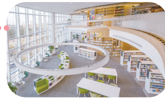
上海少年儿童图书馆新馆

室内空间功能遵从“以孩子为本”的设计方针，针对0~16岁孩子们所需的不同条件的阅读空间及学习条件需求，由低到高分层设计并设有剧场、展览、教室、实验室等兼顾学习与娱乐功能的辅助空间。