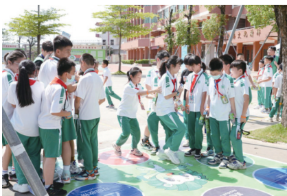
“分类新时尚，南沙再出发”——南沙垃圾分类绿色游园活动现场