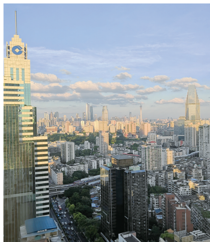
在越秀区眺望天河区与海珠区

作为广州市最繁华、最具活力的城区之一， 天河区 是“三分山水七分建成”的现代城区典范。根据规划，天河区提出构建“双核引领、轴带驱动”的城市空间结构，双核为“天河中央商务区+广州国际金融城”中央商务核、“智慧城+智谷”中央科创核，串联珠江高质量发展带、中部科创带、中央活力轴、东部创新轴，最终连线成面形成南部中央活力区、中部天河智慧城-天河智谷-环五山创新策源地、北部未来科技生态发展区等三大重点功能片区。依托市中心区位优势，天河区进一步规划提升现代服务和数字经济发展空间，提供适应初创型、成长型、成熟型等不同阶段企业需求空间和未来产业空间。往南，天河中央商务区、广州国际金融城两者相连形成南部沿江总部经济和金融服务带；往北，以天河智慧城、天河智谷、环五山创新策源地、北部未来生态科技发展区共同组成北部环国家植物园-火炉山数字经济创新高地，覆盖5G、物联网、人工智能、工业互联网、生命科学、高端教育等新兴产业。