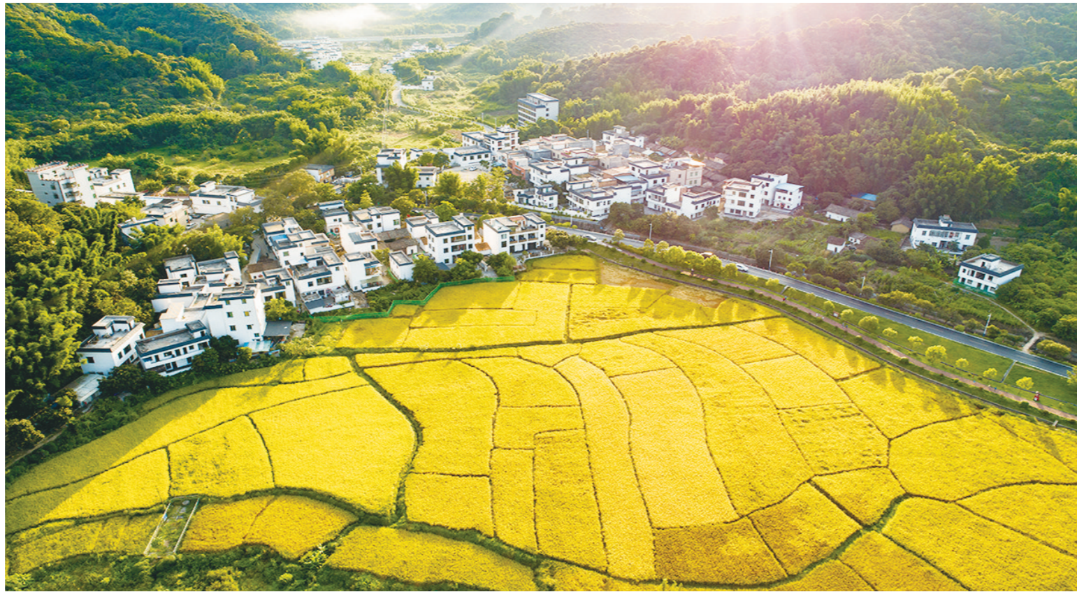
从化区良口镇米埗村

围绕广州实现老城市新活力、“四个出新出彩”发展目标，全市11区+空港经济区国土空间总体规划通过明确发展定位、发展战略和规划目标，因地制宜构建国土空间开发保护格局，建立完善经济、科技、生态、文化、交通、市政、公共服务等体系，助力广州实现“美丽宜居花城，活力全球城市”的愿景。