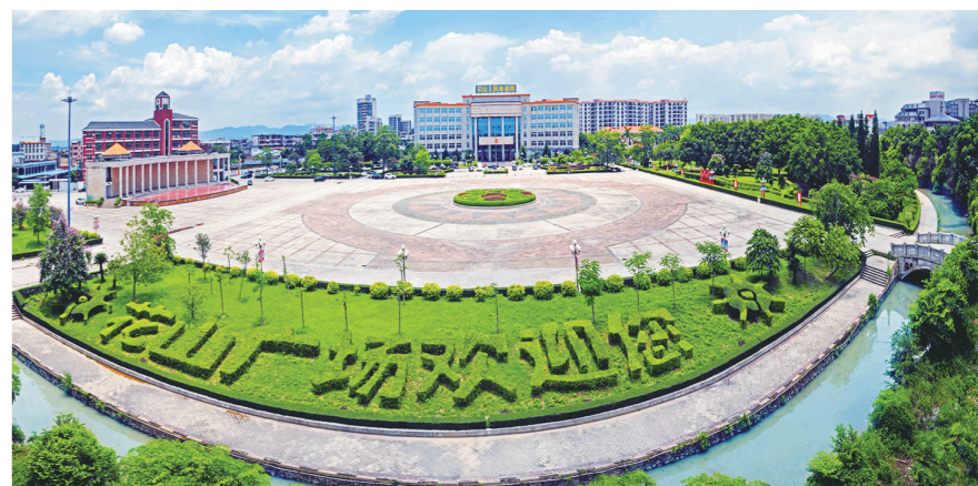
花都区花山镇花山广场