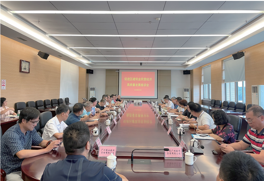
促进区建筑业民营经济高质量发展座谈会

首先，对在建工程实施差异化管理。该局根据《广州市住房和城乡建设局关于印发广州市建筑工程质量安全风险分级检查标准的通知》（穗建质〔2020〕234号），对不同风险等级、不同类别等级的工程采用不同检查标准、不同监管频次、不同检查深度的差别化管理模式，差异化、精准化实