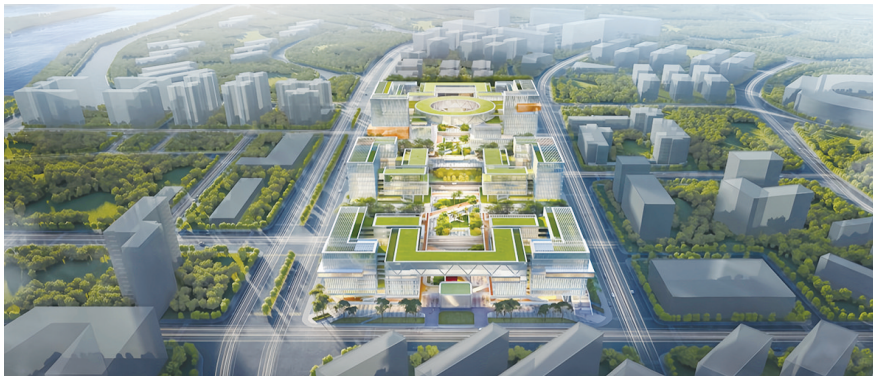
番禺大数据项目效果图

中铁建工五公司以打造区域知名、行业领先、国内一流的城市建设服务商为愿景，始终坚持以诚信、智慧、科技、管理铸就更高质量和更富情感的建筑精品。