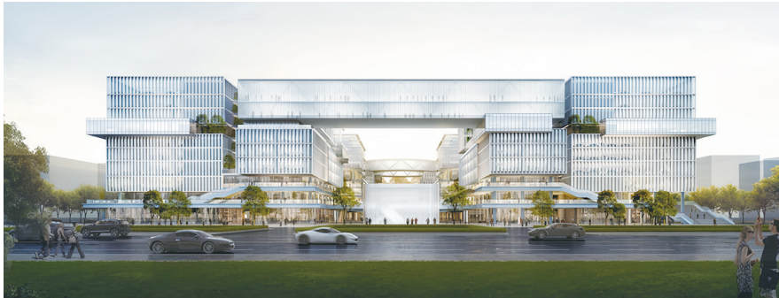
番禺大数据项目效果图