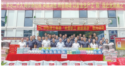
“关爱职工 夏送清凉”活动