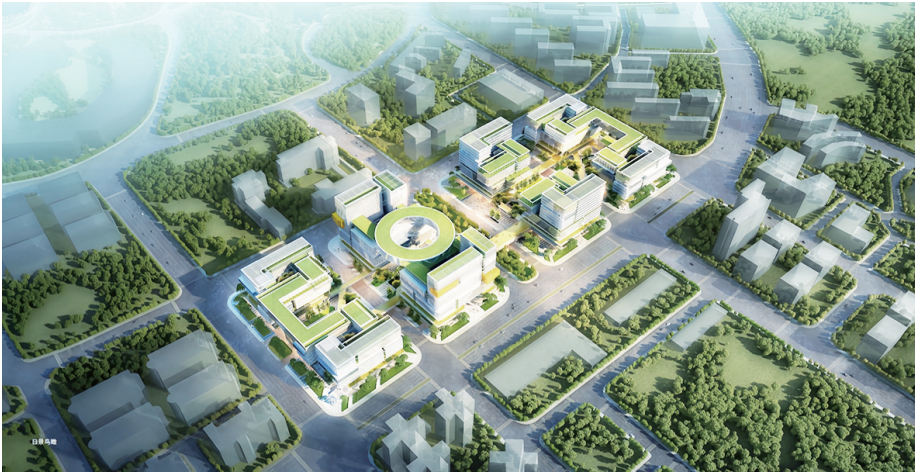
番禺大数据项目效果图

在铁路建设领域，中铁建工五公司承建了广州白云站、深圳北站、广州南站、江门站、茂名站、株洲站等重点铁路站房，中铁建工集团承接铁路站房数量更是占国内站房数量的60%以上，广泛树立了“城市综合开发最佳合作伙伴”“综合交通枢纽建设主力军”“大型公共建筑专家”和“铁路站房建设王牌军”的品牌形象。