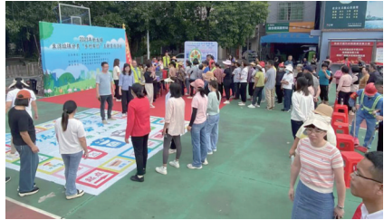
活动现场气氛热烈

下一步，黄埔区新龙镇将继续坚持党建引领，以美丽乡村建设为契机，以实施“百千万工程”为重要抓手，将农村生活垃圾治理作为实施乡村振兴战略、改善人居环境的重要突破口，多举措开展宣传教育，建立长效管理机制，让垃圾分类真正走进千家万户，“垃圾分类新时尚”在新龙镇落地开花，绘就宜居宜业和美乡村新画卷。