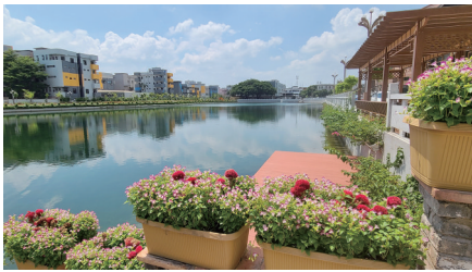
横沥隔坑村着力提升人居环境品质

步、三年初见成效、五年根本改变、十年质的飞跃”的工作目标，全面推进人居环境品质提升工作。东莞通过开展“三边三地”美化等多种措施，使得村容村貌更加靓丽；同时充分挖掘地方特色如莞府、客家文化等，因地制宜打造岭南特色乡村。近年来，横沥镇已累计建成口袋公园15个、“四小园”1002个。