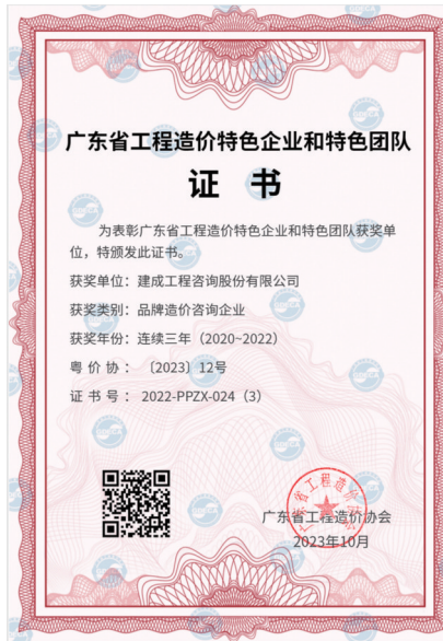
公司荣获2022年度广东省品牌价值咨询企业