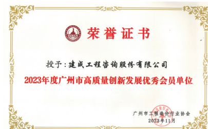
公司荣获2023年度广州市高质量创新发展优秀会员单位

今年10月，在广东省工程造价协会公布的“2022年度广东省工程造价特色企业和特色团队”评选结果中，建成咨询荣获品牌造价咨询企业（连续3年）、造价改革骨干团队、造价大数据应用研究团队（连续3年）三项荣誉。屡获殊荣的背后不仅是对建成咨询二十余载专业钻研、累积、沉淀的认可，也是对建成团队成员勤奋工作和专业能力的肯定。未来，建成咨询也将继续以创新延续品牌生命力，开创行业高质量发展新局面。