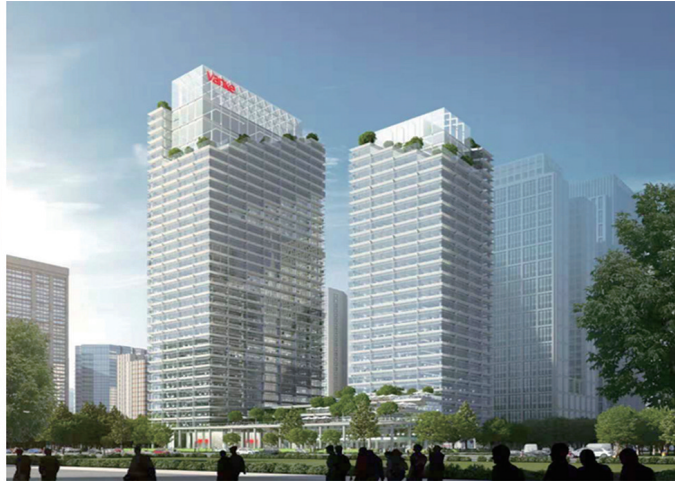
粤能管理监理的广州万科总部大楼项目荣获鲁班奖

的全产业链人才，参与全过程咨询产业链整合，利用集成化技术措施和系统性问题一站式整合服务能力，提供更多元化、专业化和定制化的全流程咨询服务模式。