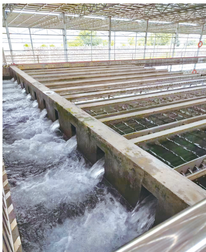
平流沉淀池出水口

罗定村多地广、地势复杂,村民多以散居为主,供水设施严重缺乏,“饮水难”已成为困扰乡村振兴的重要