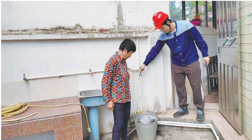
罗定粤海水务努力打通农村供水“最后一百米”,解决了部分偏远山区“饮水难”的问题。