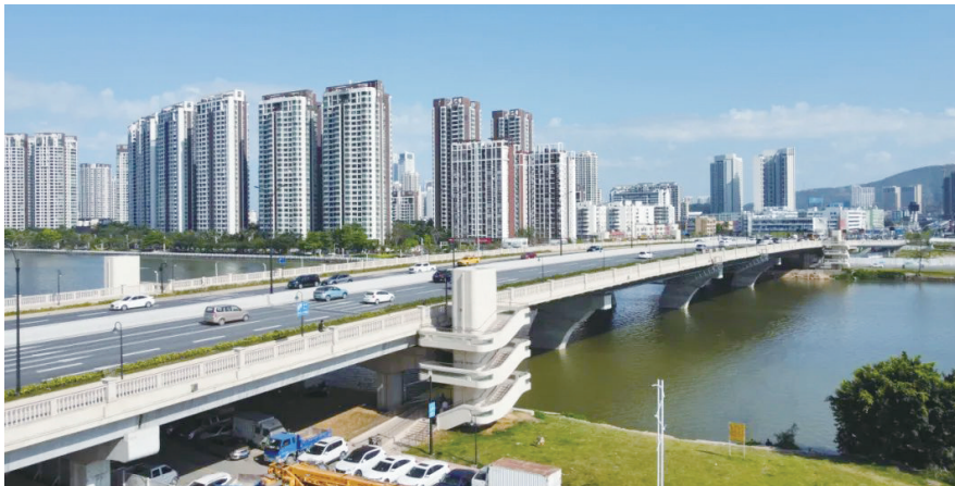
荣获国家优质工程奖的珠海市金琴快线工程项目

发的《关于表彰2022-2023年度国家优质工程奖的决定》中，36项工程被评为国家优质工程金奖，560项工程被评为国家优质工程奖。