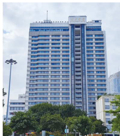
广州市历史建筑——广州宾馆

和传统风貌建筑的价值评价体系，基于真实性、完整性的研究方法及判定原则，对建筑物、构筑物的历史信息、综合价值、保存程度、安全程度四项内容开展综合评价。《评价标准》明确了历史建筑 and 传统风貌建筑的调查评价宜采用全域普查和重点调查相结合的方式，调研重点区域应为省内各地的历史城区、历史文化名镇、历史文化名村、传统村落、历史文化街区、历史地