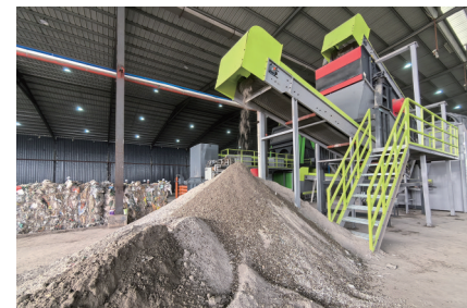
白云区卓粤固废家装建废循环利用项目