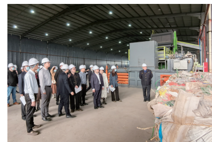
党员干部到白云区卓粤固废家装建废循环利用项目参观学习

值得一提的是，在推进居民住宅装饰装修垃圾临时堆放点建设方面，2023年，白云全区170个村（自然村和城中村）每村至少设置1个居民装饰装修垃圾临时堆放点，截至目前，全区已建好173个回收点，24个镇街已完成“一村一点”。2024年，白云区将完善居民装饰装修垃圾全链条处置体系，有效破解城市老顽疾问题，建立装饰装修废弃物源头分类收集、临时贮存、规范运输、环保处置的全过程闭环监管体系，最终形成白云区装饰装修废弃物“收、存、运、处”全链条闭环处置管理体系，力求在全市率先打造装饰装修垃圾处理示范区。