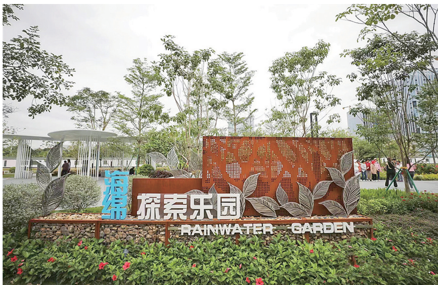
萧岗海绵探索乐园

景观效果，在重要景观节点、重点道路上，采用绿墙、绿岛等多种形式，布置精品绿化节点，让街头花木繁茂、处处见绿、步步是景。据统计，截至2023年底，白云区绿地面积21.02万亩，建成区绿化覆盖面积13.11万亩，建成区绿化覆盖率49.90%；公园绿地面积7.08万亩，人均公园绿地面积16.9平方米。