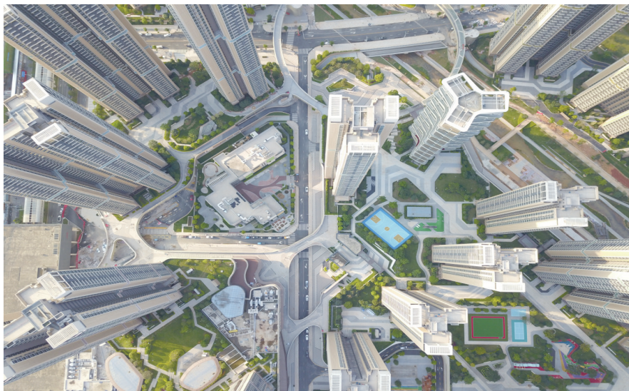
俯瞰凤凰英荟城，如同高端商品房，有力实现了从住有所居到住有宜居的提质升级。

2023年保障性租赁住房筹建数量全省第一、建成全国规模最大的装配式公共住房项目、全省首批开工建设配售型保障性住房……近年来，深圳市委、市政府结合实际，创新性提出“四跟”（跟着产业园区走、跟着大型机构走、跟着轨道交通走、跟着盘活资源走）发展战略，加大保障性住房建设筹集力度。同时，让保障性住房建设筹集与城市发展、产业发展同频共振，努力实现保障性住房高品质、多户型、便捷化、可持续，实现产城融合、职住平衡、供需匹配、城村一体，吸引各类人才选择深圳、扎根深圳，促进经济社会高质量发展。