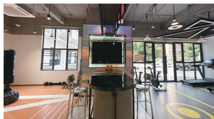
环水泊寓在公共区域设立了自习室、观影区、运动区等11个娱乐功能区，较好地满足年轻人个性化、多样化需求。