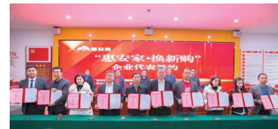
“惠安家·换新购”企业代表签约

广东建设报讯 记者姜兴贵、通讯员罗杰报道:想要置换房屋,但旧房迟迟卖不掉,手里的钱尚不够新房首付怎么办?3月1日,在惠州市住房和城乡建设局指导下,惠州市房地产业协会、惠州市房地产中介行业协会联合推出“惠安家·换新购”活动,通过强化房企、中介和购房市民之间的联动协同,切实打通市民“卖旧换新”换房置业过程中的交易堵点,加速释放惠州换房置业需求动能,助力全市房地产市场良性循环和稳健发展。