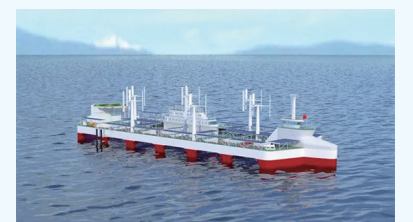
“湛江湾一号”模型。

“湛江湾一号”和“恒燄一号”投产，将助力海洋新质生产力和广东现代化海洋牧场建设提速增效。