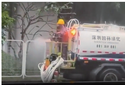
“暴雨天浇花”视频截图

视频显示，一位绿化工作人员在雨势较大时，朝路旁天桥底下绿化带浇水，作业车上印有“深圳园林绿化-龙华”字样。对于视频发布的内容，网友议论纷纷：有的网友对“雨