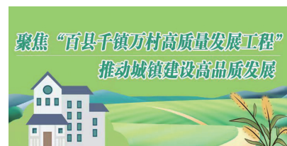
聚焦“百县千镇万村高质量发展工程” 推动城镇建设高品质发展

经过半年修缮提升，原本破旧的古亭如今已成为一个独具岭南特色的口袋公园。此番修缮不仅提升了城市整体形象、美化了周边环境，还保护了历史文化资源。康济亭也以崭新面貌继续守候在南溪村，见证珠海的日新月异。