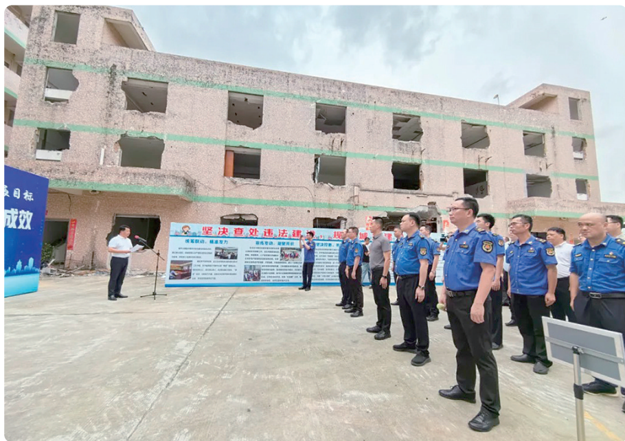
拆违现场会

广东建设报讯 记者姜兴贵、通讯员管佳报道：6月18日，东莞市城管局联合樟木头镇政府组织开展违法建筑拆除现场会，全市各镇街（园区）也于近日同步开展拆除行动，持续加大控违治违力度。据悉，樟木头镇现场会拆除的违法建筑位于裕丰社区宝昌街3号，建筑占地面积1220平方米，违法建筑面积3830平方米，随着行动启动，该违建被逐层拆除。