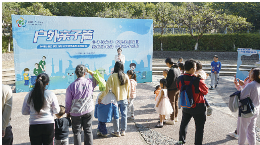
宣传员对垃圾分类知识进行科普