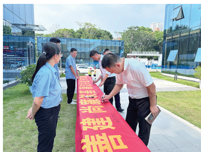
中建二局二公司安装分公司开展关键岗位人员廉洁警示教育

广东建设报讯 记者蒋雯菁、通讯员杨啸报道：为提升监督创效能力，中建二局二公司安装分公司创新“三面镜”工作法开展“三创（3C）”专项监督活动。目前，该公司已发布“3C”创效监督检查通报3期，实施奖惩12人次，推动科技、商务、招采创效跑出降本增效“加速度”。